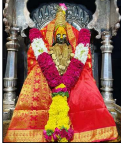
आई तुळजा भवानी